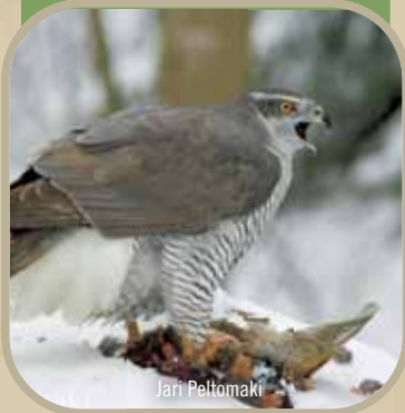
Autour des palombes