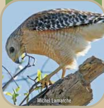
Buse à épaulettes